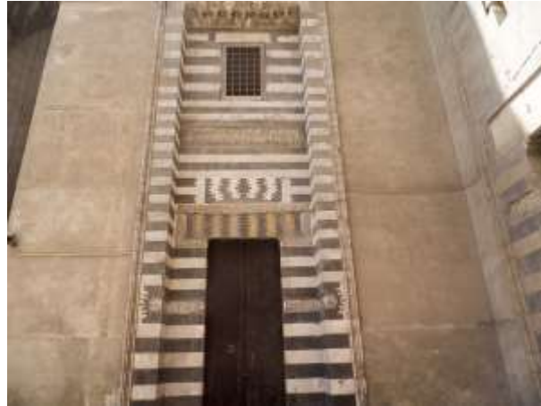
صورة رقم (24) توضح باب المدرسة الحنفية(9)