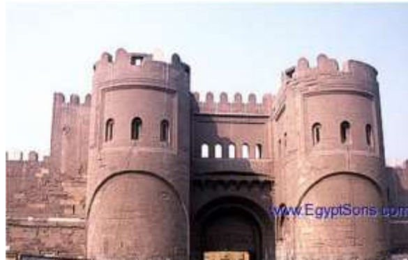
صورة رقم (20) لباب الفتوح (10)