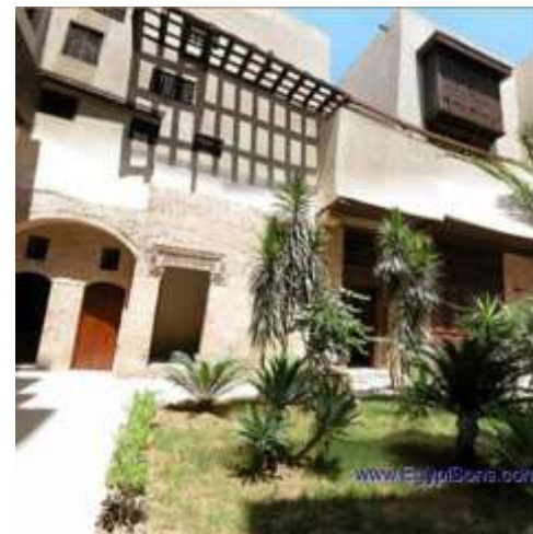
صور رقم (25 و26 و27 و28) لببيت السحيمي(10)