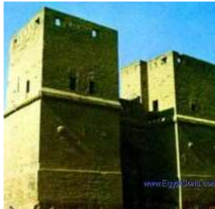
صورة رقم (21) لباب النصر (10)