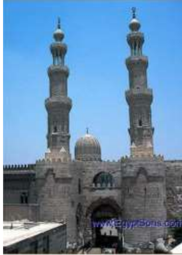
صورة رقم (19) لباب زويلة (10)